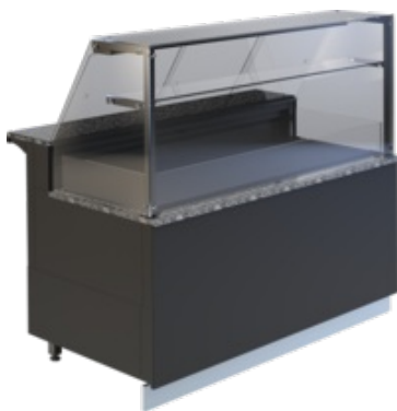
Artikel-Nr.: 734200 GTIN: 4059395051148

Idealer Einsatz für Speisenausgabensysteme in Restaurants und Kleingastronomie, individuelle Farb- und Darstellungsmöglichkeiten daher idealer Einsatz für den Ladenbau und Gastronomieeinrichter.