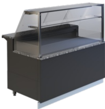
Artikel-Nr.: 734150 GTIN: 4059395051131

Idealer Einsatz für Speisenausgabensysteme in Restaurants und Kleingastronomie, individuelle Farb- und Darstellungsmöglichkeiten daher idealer Einsatz für den Ladenbau und Gastronomieeinrichter.