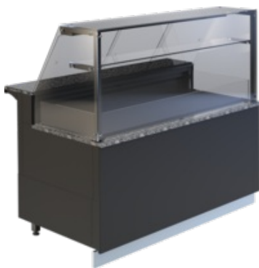
Artikel-Nr.: 734100 GTIN: 4059395051124

Idealer Einsatz für Speisenausgabensysteme in Restaurants und Kleingastronomie, individuelle Farb- und Darstellungsmöglichkeiten daher idealer Einsatz für den Ladenbau und Gastronomieeinrichter.