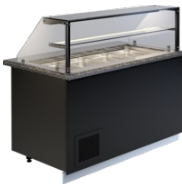
Artikel-Nr.: 732120 GTIN: 4059395050936

Idealer Einsatz für Speisenausgabensysteme in Restaurants und Kleingastronomie, individuelle Farb- und Darstellungsmöglichkeiten daher idealer Einsatz für den Ladenbau und Gastronomieeinrichter.