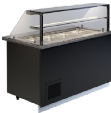
Artikel-Nr.: 732100 GTIN: 4059395050929

Idealer Einsatz für Speisenausgabensysteme in Restaurants und Kleingastronomie, individuelle Farb- und Darstellungsmöglichkeiten daher idealer Einsatz für den Ladenbau und Gastronomieeinrichter.