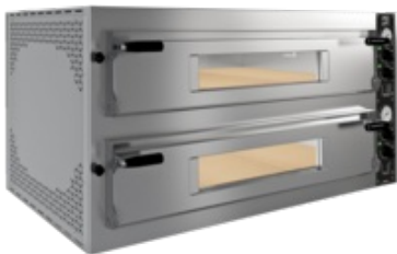
Artikel-Nr.: 55052131 GTIN: 4059395072433

Um für Elektrogeräte (nicht steckerfertig, 400 V) und Gasgeräte aus dem Bereich Thermik eine 24-monatige Vollgarantie zu erlangen, sind der Anschluss und die Erstinbetriebnahme durch ein Fachunternehmen durchzuführen. Hier Direkt zur Garantiekarte.