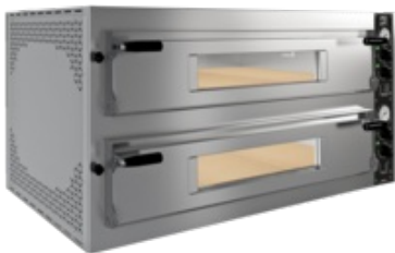
Artikel-Nr.: 55052130 GTIN: 4059395072426

Um für Elektrogeräte (nicht steckerfertig, 400 V) und Gasgeräte aus dem Bereich Thermik eine 24-monatige Vollgarantie zu erlangen, sind der Anschluss und die Erstinbetriebnahme durch ein Fachunternehmen durchzuführen. Hier Direkt zur Garantiekarte.