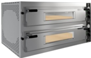
Artikel-Nr.: 55052129 GTIN: 4059395072419

Um für Elektrogeräte (nicht steckerfertig, 400 V) und Gasgeräte aus dem Bereich Thermik eine 24-monatige Vollgarantie zu erlangen, sind der Anschluss und die Erstinbetriebnahme durch ein Fachunternehmen durchzuführen. Hier Direkt zur Garantiekarte.