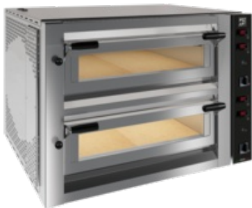
Artikel-Nr.: 55052127 GTIN: 4059395071979

Um für Elektrogeräte (nicht steckerfertig, 400 V) und Gasgeräte aus dem Bereich Thermik eine 24-monatige Vollgarantie zu erlangen, sind der Anschluss und die Erstinbetriebnahme durch ein Fachunternehmen durchzuführen. Hier Direkt zur Garantiekarte.