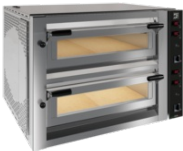
Artikel-Nr.: 55052126 GTIN: 4059395071962

Um für Elektrogeräte (nicht steckerfertig, 400 V) und Gasgeräte aus dem Bereich Thermik eine 24-monatige Vollgarantie zu erlangen, sind der Anschluss und die Erstinbetriebnahme durch ein Fachunternehmen durchzuführen. Hier Direkt zur Garantiekarte.