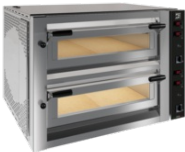
Artikel-Nr.: 55052125 GTIN: 4059395071955

Um für Elektrogeräte (nicht steckerfertig, 400 V) und Gasgeräte aus dem Bereich Thermik eine 24-monatige Vollgarantie zu erlangen, sind der Anschluss und die Erstinbetriebnahme durch ein Fachunternehmen durchzuführen. Hier Direkt zur Garantiekarte.