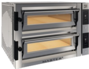
Artikel-Nr.: 55052123 GTIN: 4059395071894

Um für Elektrogeräte (nicht steckerfertig, 400 V) und Gasgeräte aus dem Bereich Thermik eine 24-monatige Vollgarantie zu erlangen, sind der Anschluss und die Erstinbetriebnahme durch ein Fachunternehmen durchzuführen. Hier Direkt zur Garantiekarte.