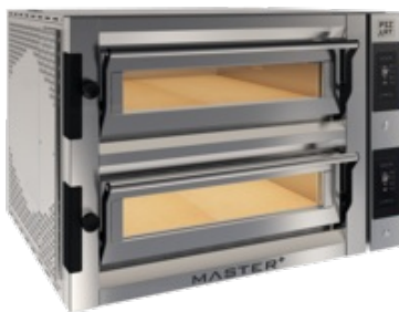
Artikel-Nr.: 55052122 GTIN: 4059395071887

Um für Elektrogeräte (nicht steckerfertig, 400 V) und Gasgeräte aus dem Bereich Thermik eine 24-monatige Vollgarantie zu erlangen, sind der Anschluss und die Erstinbetriebnahme durch ein Fachunternehmen durchzuführen. Hier Direkt zur Garantiekarte.