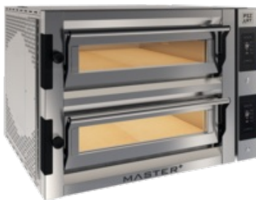
Artikel-Nr.: 55052120 GTIN: 4059395071863

Um für Elektrogeräte (nicht steckerfertig, 400 V) und Gasgeräte aus dem Bereich Thermik eine 24-monatige Vollgarantie zu erlangen, sind der Anschluss und die Erstinbetriebnahme durch ein Fachunternehmen durchzuführen. Hier Direkt zur Garantiekarte.