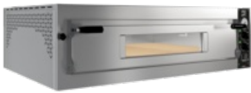
Artikel-Nr.: 55051131 GTIN: 4059395072396

Um für Elektrogeräte (nicht steckerfertig, 400 V) und Gasgeräte aus dem Bereich Thermik eine 24-monatige Vollgarantie zu erlangen, sind der Anschluss und die Erstinbetriebnahme durch ein Fachunternehmen durchzuführen. Hier Direkt zur Garantiekarte.