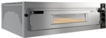
Artikel-Nr.: 55051130 GTIN: 4059395072389

Um für Elektrogeräte (nicht steckerfertig, 400 V) und Gasgeräte aus dem Bereich Thermik eine 24-monatige Vollgarantie zu erlangen, sind der Anschluss und die Erstinbetriebnahme durch ein Fachunternehmen durchzuführen. Hier Direkt zur Garantiekarte.