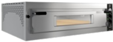
Artikel-Nr.: 55051129 GTIN: 4059395072372

Um für Elektrogeräte (nicht steckerfertig, 400 V) und Gasgeräte aus dem Bereich Thermik eine 24-monatige Vollgarantie zu erlangen, sind der Anschluss und die Erstinbetriebnahme durch ein Fachunternehmen durchzuführen. Hier Direkt zur Garantiekarte.