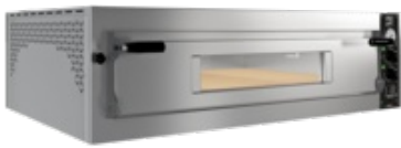
Artikel-Nr.: 55051128 GTIN: 4059395071986

Um für Elektrogeräte (nicht steckerfertig, 400 V) und Gasgeräte aus dem Bereich Thermik eine 24-monatige Vollgarantie zu erlangen, sind der Anschluss und die Erstinbetriebnahme durch ein Fachunternehmen durchzuführen. Hier Direkt zur Garantiekarte.