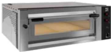
Artikel-Nr.: 55051126 GTIN: 4059395071924

Um für Elektrogeräte (nicht steckerfertig, 400 V) und Gasgeräte aus dem Bereich Thermik eine 24-monatige Vollgarantie zu erlangen, sind der Anschluss und die Erstinbetriebnahme durch ein Fachunternehmen durchzuführen. Hier Direkt zur Garantiekarte.