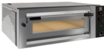
Artikel-Nr.: 55051125 GTIN: 4059395071917

Um für Elektrogeräte (nicht steckerfertig, 400 V) und Gasgeräte aus dem Bereich Thermik eine 24-monatige Vollgarantie zu erlangen, sind der Anschluss und die Erstinbetriebnahme durch ein Fachunternehmen durchzuführen. Hier Direkt zur Garantiekarte.