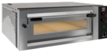
Artikel-Nr.: 55051124 GTIN: 4059395071900

Um für Elektrogeräte (nicht steckerfertig, 400 V) und Gasgeräte aus dem Bereich Thermik eine 24-monatige Vollgarantie zu erlangen, sind der Anschluss und die Erstinbetriebnahme durch ein Fachunternehmen durchzuführen. Hier Direkt zur Garantiekarte.