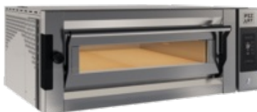
Artikel-Nr.: 55051123 GTIN: 4059395071856

Um für Elektrogeräte (nicht steckerfertig, 400 V) und Gasgeräte aus dem Bereich Thermik eine 24-monatige Vollgarantie zu erlangen, sind der Anschluss und die Erstinbetriebnahme durch ein Fachunternehmen durchzuführen. Hier Direkt zur Garantiekarte.