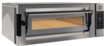
Artikel-Nr.: 55051121 GTIN: 4059395071832

Um für Elektrogeräte (nicht steckerfertig, 400 V) und Gasgeräte aus dem Bereich Thermik eine 24-monatige Vollgarantie zu erlangen, sind der Anschluss und die Erstinbetriebnahme durch ein Fachunternehmen durchzuführen. Hier Direkt zur Garantiekarte.