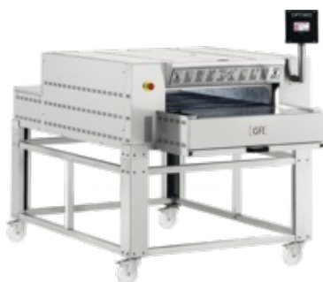
Artikel-Nr.: 50531015 GTIN: 4059395071757

Um für Elektrogeräte (nicht steckerfertig, 400 V) und Gasgeräte aus dem Bereich Thermik eine 24-monatige Vollgarantie zu erlangen, sind der Anschluss und die Erstinbetriebnahme durch ein Fachunternehmen durchzuführen. Hier Direkt zur Garantiekarte.