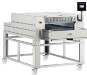
Artikel-Nr.: 50531013 GTIN: 4059395071733

Um für Elektrogeräte (nicht steckerfertig, 400 V) und Gasgeräte aus dem Bereich Thermik eine 24-monatige Vollgarantie zu erlangen, sind der Anschluss und die Erstinbetriebnahme durch ein Fachunternehmen durchzuführen. Hier Direkt zur Garantiekarte.