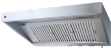
Artikel-Nr.: 30123032 GTIN: 4059395042436