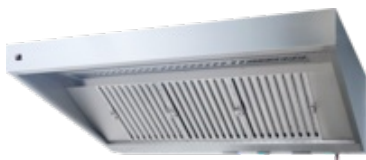
Artikel-Nr.: 30121032 GTIN: 4059395042252