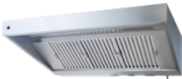
Artikel-Nr.: 30121031 GTIN: 4059395042245